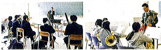
5月12日 秋田県中央吹奏楽連盟初心者講習会