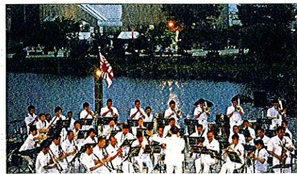
6月8日 南極公園水上ステージ