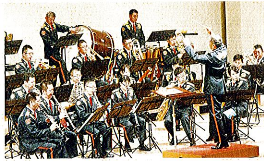
陸上自衛隊第9音楽隊(青森)

北東北3県(青森、秋田、岩手)を活動地域として、各種イベント等で年間約80回の演奏を実施している。