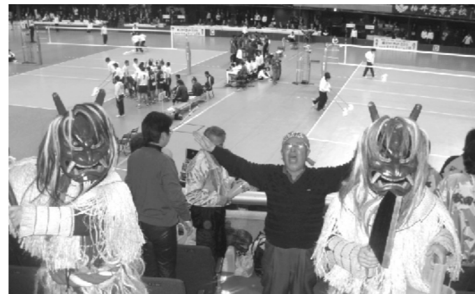
女子バレーボール(秋田和洋女子)の応援