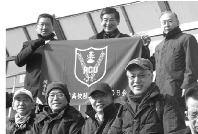
秋田工業駅伝の応援(西京極陸上競技場)