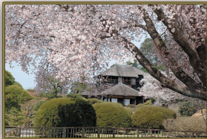
佐々木 進 (S40S) 文を好めば則ち梅開き、学を廃すれば則ち梅開かず いくつになっても、学は必要なんだね