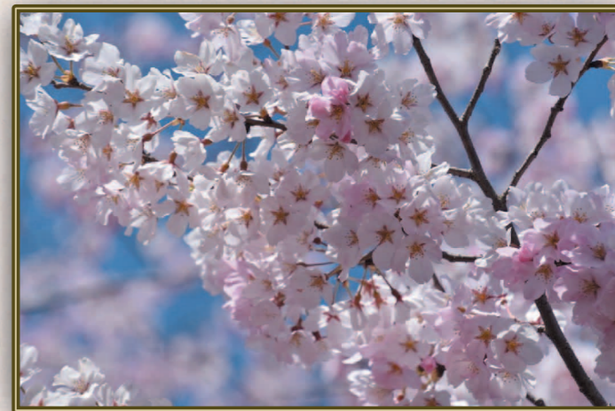
三平 俊悦 (S39A) 花園満開いつのことかな?