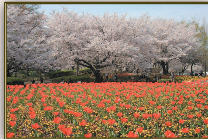
市川 正 (S41E) 桜と赤いチュウリップの色の対比がきれいでした