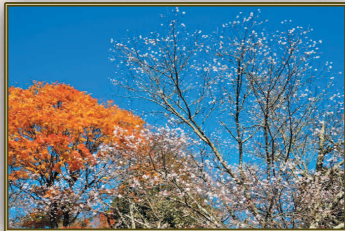
加藤 幸夫 (S36M) 晩秋の空に染まる紅葉と咲く冬桜、一刻の共演