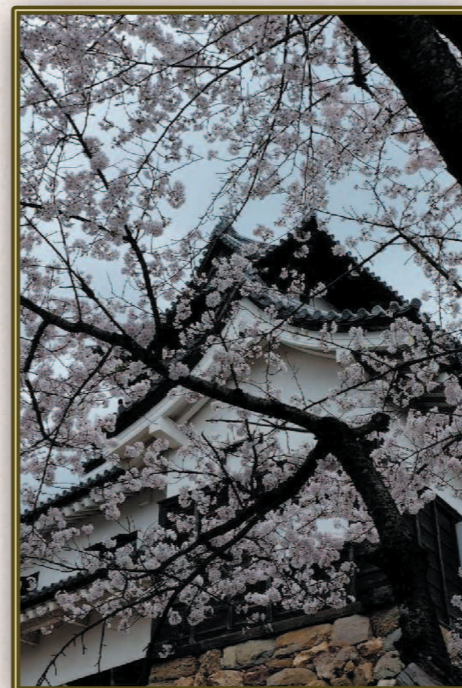
佐々木 進 (S40S) 歴史の荒波を乗り越り生き残った国宝 桜の木がみえましたかな? 天守閣からの木曾川の眺めは最高でした。