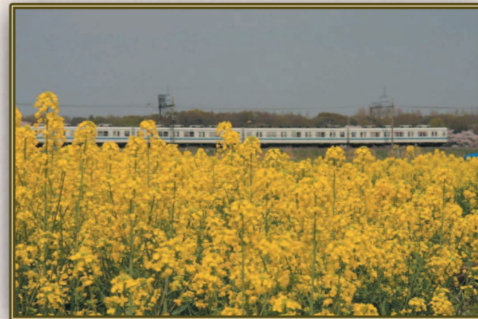
市川 正 (S41E) 花と鉄道がブームとか、一枚撮ってみました