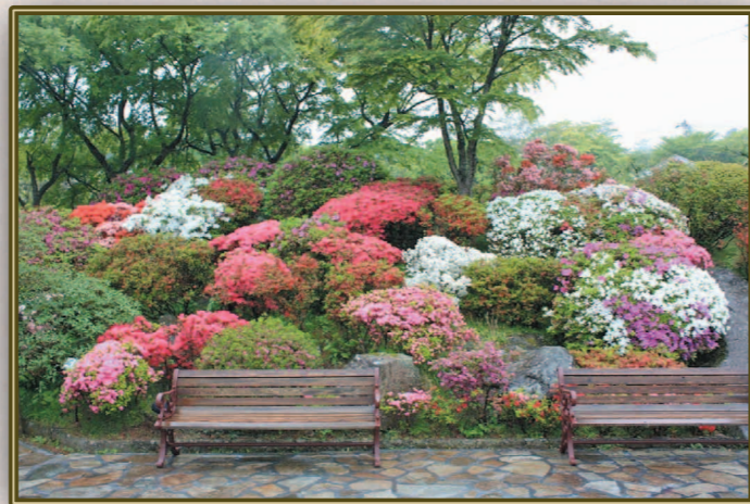
地主 勝己 (S37C) 日を浴びて 笑顔満開 つつじ見て