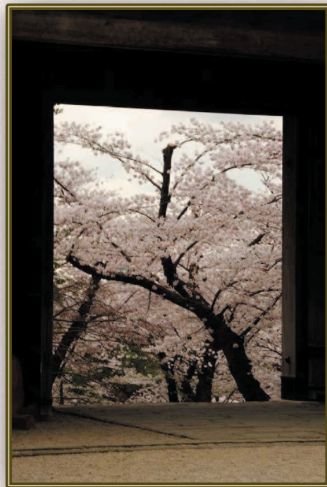
堀 健市 (S38A) 千秋公園の桜、樹齢百年