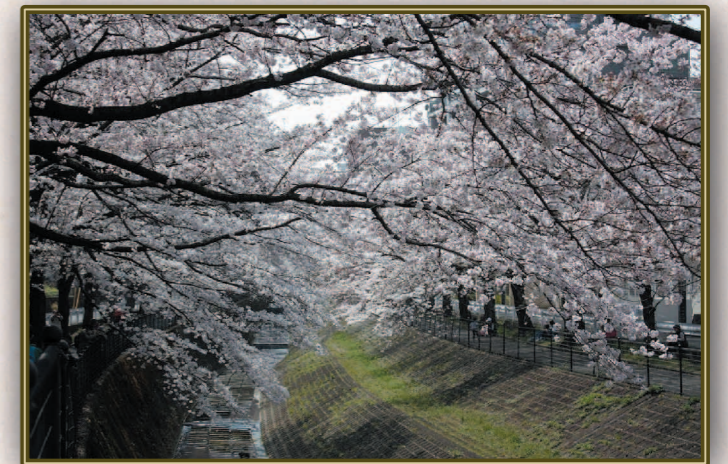
地主 勝己 (S37C) たたずめば 川面に浮かぶ 落花かな