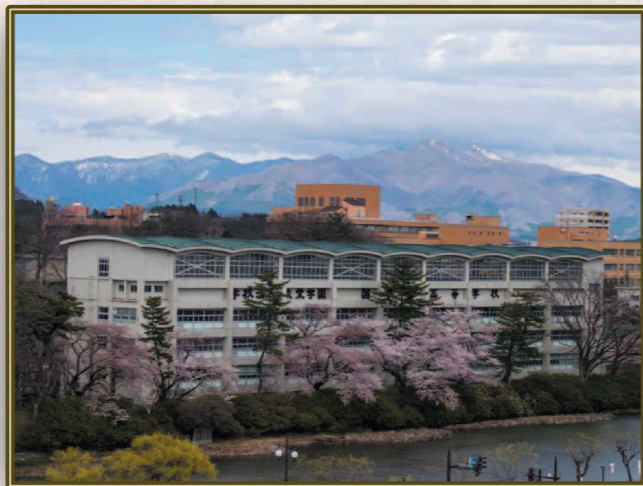
赤川 均 (S41E) 花冷えの日、太平山が凛たる雄姿を見せていました