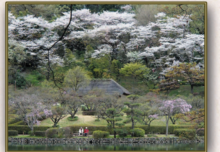
赤川 均 (S41E) 桜から新緑へ足早に移る行く春を静かに味わいたいものです