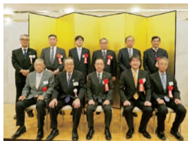
来賓記念撮影がありました。

新人戦では勝った相手に本番の(県大会)決勝では接戦になったり負けたりするが今年は決勝で36対0で快勝しすっきりした。