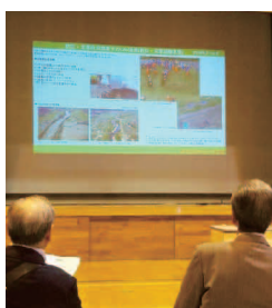
旧小学校で講演聴講

企業訪問は大館にある「東光鉄工株式会社」。最初に旧小学校の校舎で開発・販売をしているドローンの説明を受け、校庭で試験飛行を見学させていただきました。現時点では農業散布用のドローンの航行は手動の遠隔操作に限定されていますが、自動航行の解禁が近く迫る中、新型ドローンの開発をしているとのことでした。新型は空撮映像を分析して、航行プログラムを自動