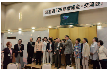
平成29年度総会・交流会