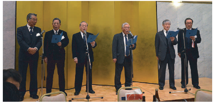
東京秋工会<金砂健児の集い>にて

皆さんも是非健康と長寿のために詩吟をやってみてはいかがでしょうか。ご参加をお待ちしております。