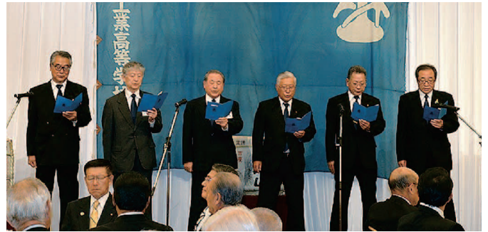
母校創立百周年祝賀会にて