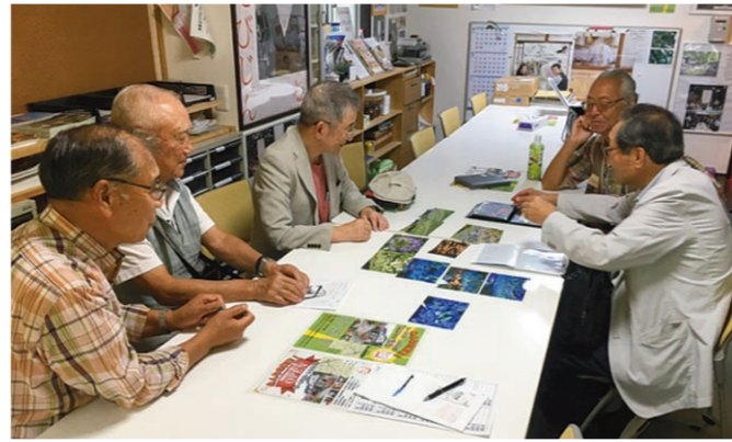
7月10日会議の様子