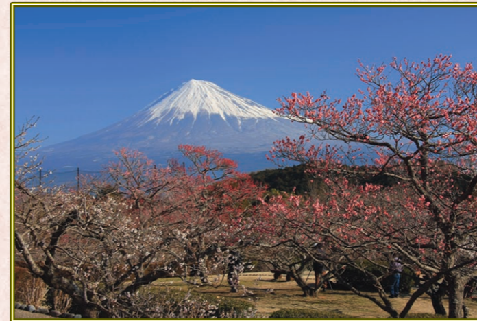
市川 正 (S41E)