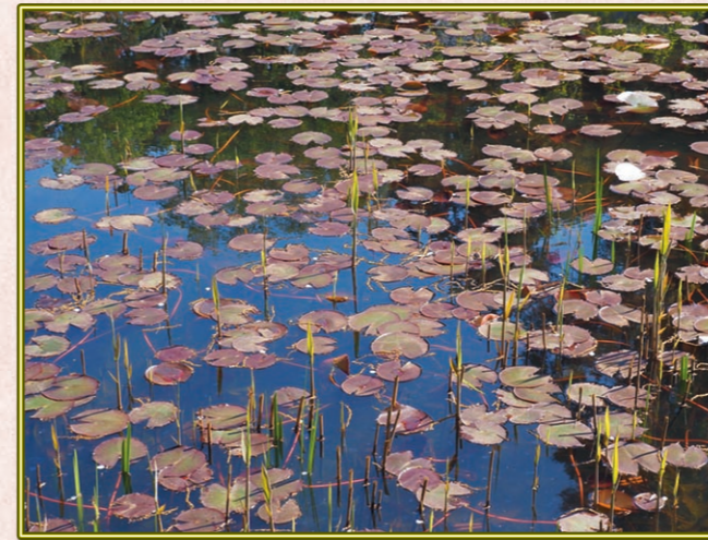
堀 健市 (S38A) 横浜市旭区こども自然公園で眼に止まり