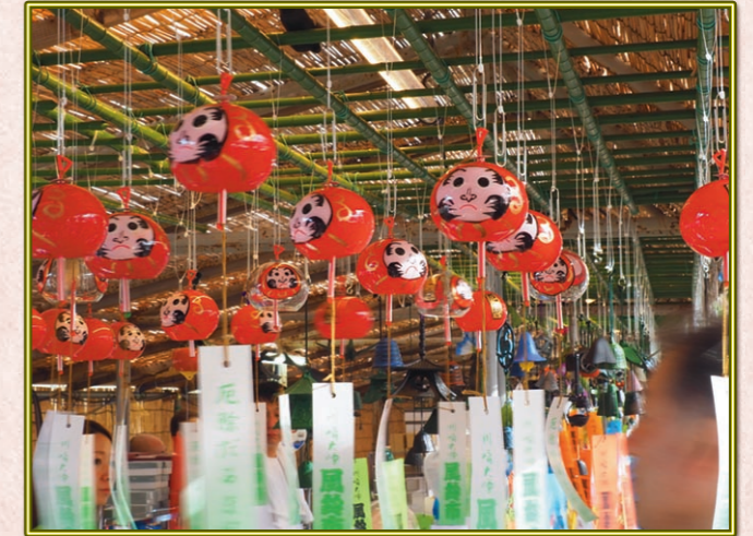
堀 健市 (S38A) 全国の風鈴勢揃い、川崎大師オリジナルの風鈴