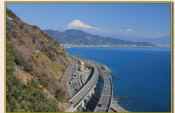
市川 正 (S41E)