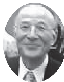
橋本五郎 読売新聞