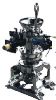
ブリッジプレーカー (ピンスクレーパー) マグネットセパレーター (ロータリーマグネット) 解砕(ほぐし)機