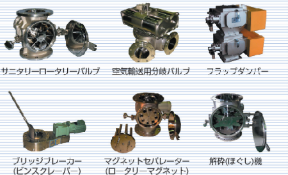
サニタリーロータリーバルブ 空気輸送用分岐バルブ フラップダンパー