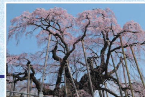
凜として咲く 三春町