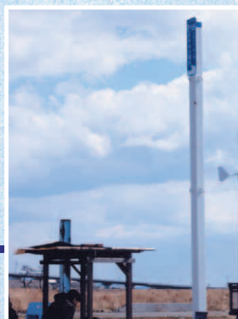
津波浸水深・荒野 石巻市南浜町