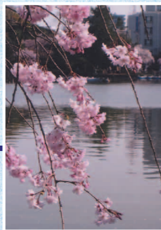
綿打池の桜 1 千葉公園