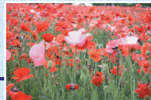
乙女は踊る 立川市昭和記念公園