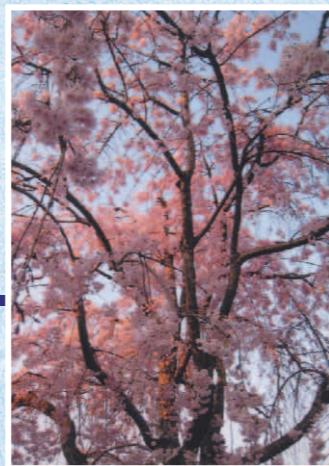
綿打池の桜 2 千葉公園