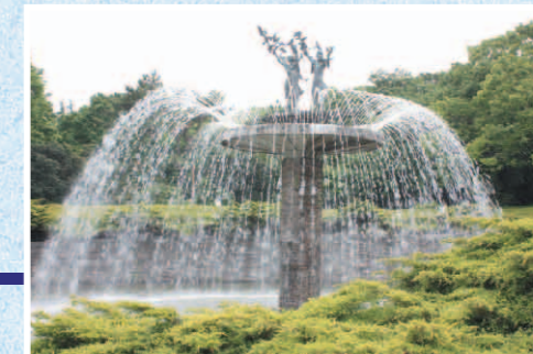
夏の予感 立川市昭和記念公園