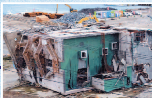
津波による被害・無残 宮城県女川町