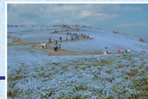
碧に漂う ひたちなか市