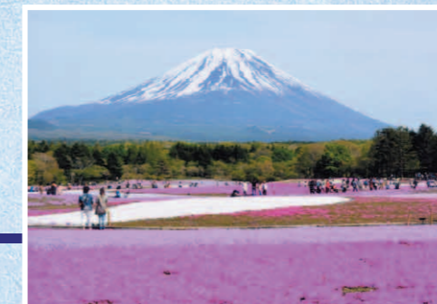
富士と芝桜 本栖湖