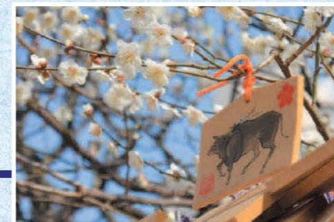
梅に願いを 湯島天神