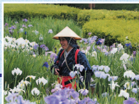
花摘み娘 町田市・薬師池公園