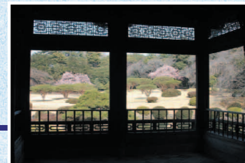
御涼亭より 新宿御苑