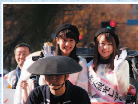
秋田観光レディ 銀座パレード